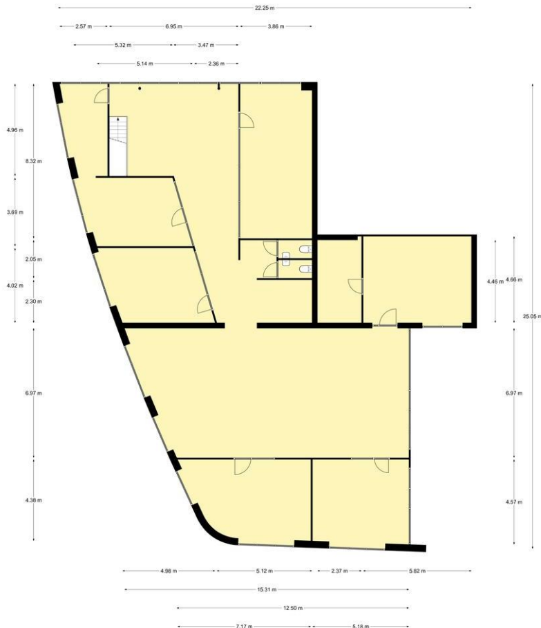
1e Verdieping, Maanlander 11 te Amersfoort De plattegronden zijn geschikt voor promotionele doeleinden. Er kunnen geen rechten aan ontleend worden.